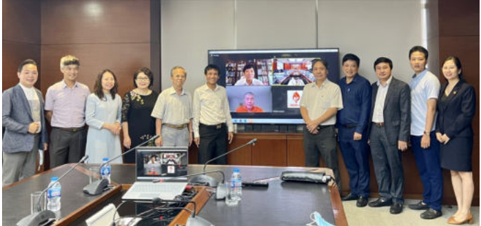
Hiệp hội Khởi nghiệp Quốc gia chính thức công bố quyết định thành lập tại Hà Nội ngày 8/7

Baodantoc.vn - Hiệp hội Khởi nghiệp Quốc gia sẽ là nơi ươm mầm và nâng tầm doanh nhân Việt, đồng thời, tập hợp và thúc đẩy tinh thần khởi nghiệp, sáng lập doanh nghiệp.