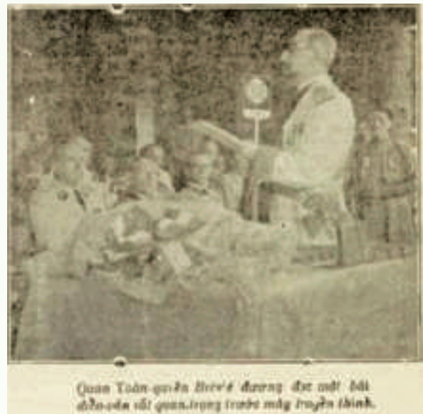
Ảnh của báo Mai, ngày 12/6/1937