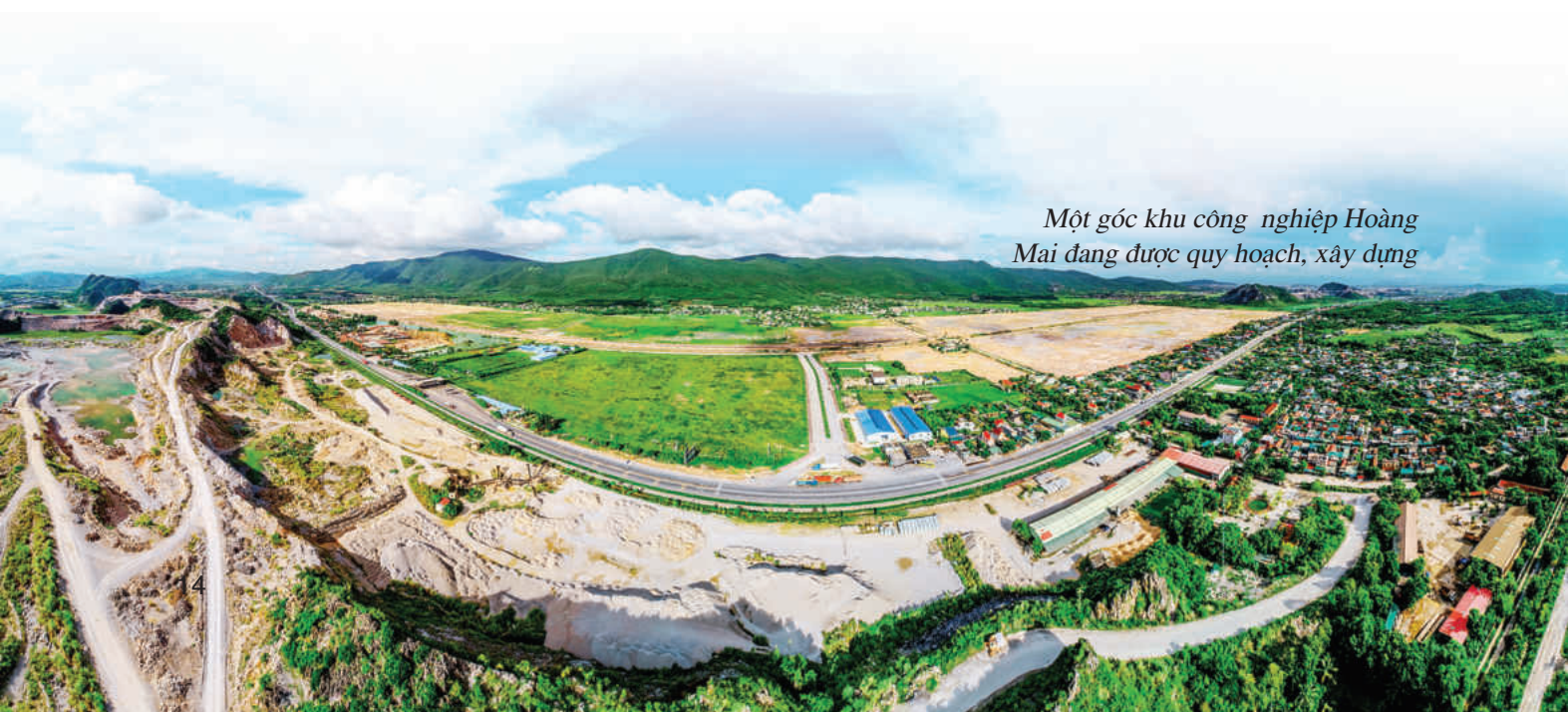
Một góc khu công nghiệp Hoàng Mai đang được quy hoạch, xây dựng

Tập trung mời gọi nhà đầu tư chiến lược tạo ra chuỗi ngành.