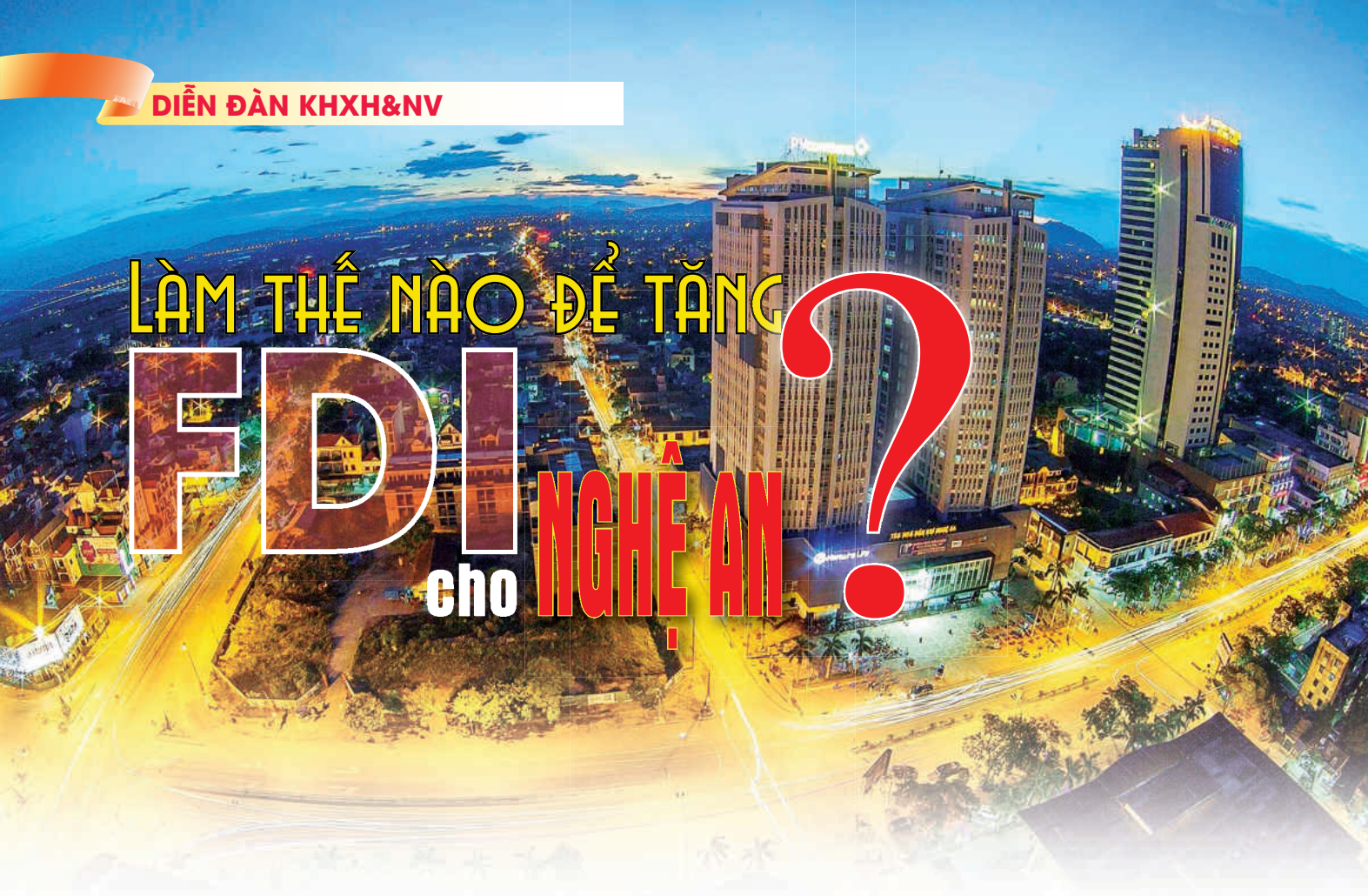
Một góc thành phố Vinh