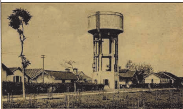
Bệnh viện bản xứ Vinh (ảnh trong sách “L’assistance médicale Indigène en Indochine Organisation & fonctionnement, 1908”)