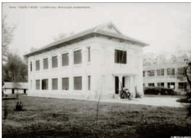
Khu bệnh viện giành cho người Âu

Về chế độ khám chữa bệnh ở bệnh viện Vinh, sách “Hương chính chi nam” (12) viết: “Người đến điều trị bệnh có thể lựa chọn cách chữa bệnh trả tiền, hoặc chữa bệnh làm phúc. Đặt ra hai hạng ấy để phân biệt người sang người hèn và để cho đỡ tiền nhà nước ra. Hạng trả tiền có chỗ nằm tử tế hơn hạng làm phúc và ăn uống cũng sang hơn, còn thuốc thang và cách chữa không khác gì cả. Người bệnh ở hạng làm phúc thì từ ăn uống, quần áo, thuốc thang đều được nhà thương chi trả. Bệnh nhân trả tiền có ba hạng: Hạng nhất mỗi ngày 1 đồng; hạng nhì mỗi ngày 0,7 đồng; hạng ba mỗi ngày 0,4 đồng. Tiền ấy nhà thương thu rồi