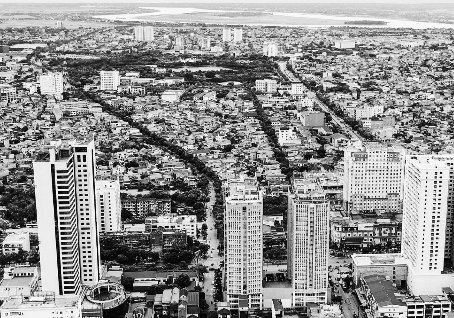
Toàn cảnh thành phố Vinh hôm nay