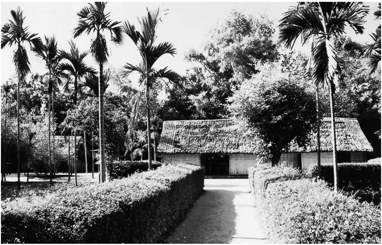
Làng Hoàng Trù - Quê ngoại Bác Hồ thu hút hàng triệu lượt khách du lịch mỗi năm

Trên địa bàn huyện còn có hệ thống các chùa lớn vừa được bảo tồn, tôn tạo như chùa Đại Tuệ (Nam Anh), chùa Viên Quang (Nam Thanh), chùa Hà (Hưng Tiên), chùa Vĩnh Phúc (Nam Xuân)... Đặc biệt là đền Chung Sơn (Kim Liên) được khánh thành năm 2020, là nơi thờ tự những người thân trong gia đình Bác Hồ.