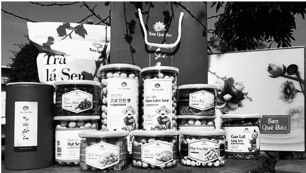
Các sản phẩm từ sen của HTX Sen quê Bắc đang được khách hàng đón nhận và đánh giá cao

nghiệm vườn đôi Eo Gió (xã Nam Giang); du lịch trải nghiệm vườn đôi tại đập Cửa Ông (xã Nam Nghĩa); du lịch sinh thái, trải nghiệm, nghỉ dưỡng tại Thung Pheo (xã Nam Anh). Hạ tầng giao thông, hạ tầng du lịch, hạ tầng văn hóa được đầu tư xây dựng theo hướng đồng bộ, hiện đại. Ưu tiên các công trình, dự án trọng điểm về văn hóa gắn với du lịch. Tỷ lệ đường huyện, đường xã đạt chuẩn là 100%; tỷ lệ đường trục xóm, ngõ xóm đạt chuẩn 98%. Hoàn thiện các hạng mục công trình tại Trung tâm Văn hóa Thể thao & Truyền thông huyện đạt chuẩn; 100% số xã có Trung tâm văn hóa thể thao đạt chuẩn. Đầu tư xây dựng và hoàn thiện một số công trình hạ tầng kết nối du lịch như cảnh quan tuyến đường vào quê nội, quê ngoại Bắc Hồ, đường giao thông kết nối các di tích, các điểm di tích lịch sử văn hóa gắn với du lịch trên địa bàn huyện. Chú trọng xây dựng các xóm, khối đạt tiêu chí “sáng - xanh - sạch - đẹp”; xây dựng khu dân cư kiểu mẫu; xây dựng vườn mẫu, vườn chuẩn nông thôn mới. Đến nay, toàn huyện có 9 xã đạt chuẩn nông thôn mới nâng cao, trong đó có 5 xã đạt chuẩn nông thôn mới kiểu mẫu.