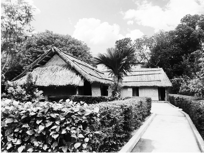
Khu Di tích lưu niệm Phan Bội Châu

xuất và cung cấp nông sản, sản phẩm thủ công của làng nghề truyền thống. Du lịch nông thôn sử dụng cơ sở vật chất kỹ thuật của cộng đồng vùng nông thôn (bản làng, nhà truyền thống), các thiết chế văn hóa làng (đình, đền, giếng nước...), các cơ sở sản xuất nghề truyền thống, cơ sở hạ tầng (đường, điện, nước, dịch vụ viễn thông...) gắn với môi trường tự nhiên, bản sắc văn hóa và các hoạt động sinh hoạt sản xuất nông nghiệp của cộng đồng dân cư.