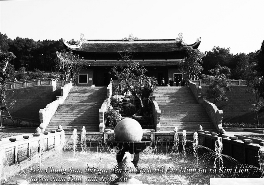
Đền Chung Sơn, thờ gia tiên Chủ tịch Hồ Chí Minh tại xã Kim Liên, huyện Nam Đàn, tỉnh Nghệ An