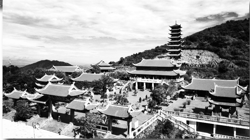
Chùa Đại Tuệ trên núi Đại Huệ

D u lịch nông thôn (Rural Tourism) được hiểu là loại hình du lịch diễn ra ở khu vực nông thôn, với quy mô kinh doanh nhỏ, không gian mở, được tiếp xúc trực tiếp và hòa mình vào thiên nhiên, gắn với những đặc điểm tiêu biểu ở khu vực nông thôn, những di sản văn hóa xã hội và văn hóa truyền thống ở làng xã...; thể hiện đặc tính đa dạng về môi trường, kinh tế, lịch sử, địa điểm của mỗi vùng nông thôn.