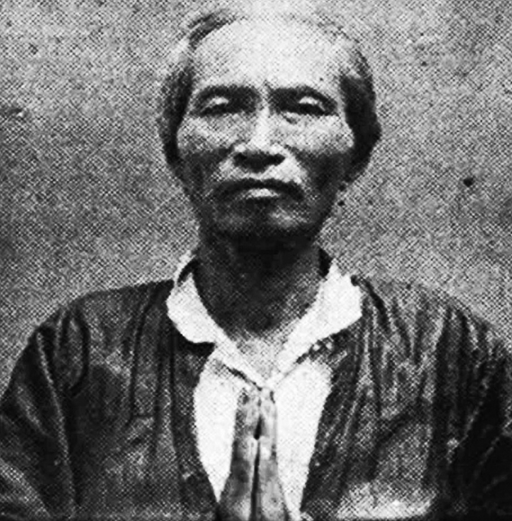
Cù Nguyễn Sinh Sắc, thân sinh Bác Hồ