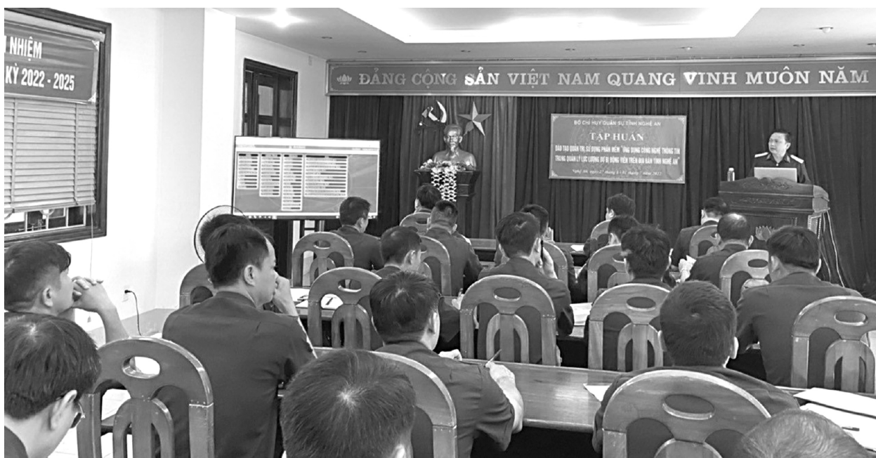
Ứng dụng công nghệ thông tin trong quản lý lực lượng dự bị động viên trên địa bàn tỉnh Nghệ An

■ Thượng tá Trần Hưng Nhân Bộ Chỉ huy Quân sự tỉnh Nghệ An