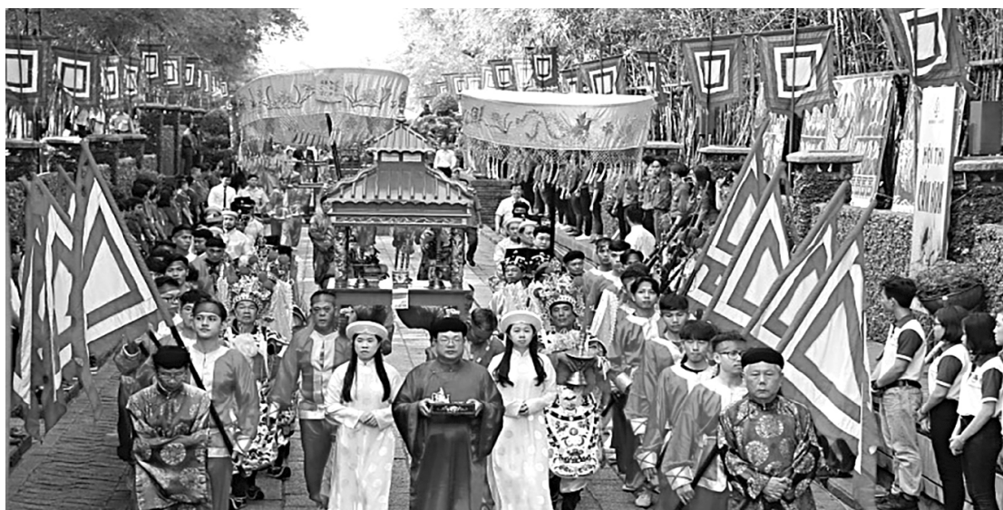
Văn hóa là nguồn lực phát triển bền vững của quốc gia (Ảnh: Giỗ tổ Hùng Vương)

không nhìn thấy nhiều lợi nhuận... Vấn đề là chúng ta cần có tầm nhìn giải mã mang tính đột phá cho hiện trạng này chính là “thị trường và thị trường hơn” cho văn hóa, biến văn hóa thành một món hàng quý giá, bởi bản thân văn hóa là một quá trình tiếp biến thì khi chúng ta mong muốn văn hóa phát triển bền vững chính chúng ta cũng cần thay đổi tư duy và biện pháp đưa văn hóa phù hợp trong bối cảnh mới, bối cảnh hội nhập quốc tế sâu rộng, việc khai thác, phát huy vai trò, giá trị của văn hóa trong các hoạt động kinh tế, chính trị, xã hội đã và đang được các quốc gia đẩy mạnh, tăng cường thông qua chiến lược ngoại giao văn hóa, đối thoại văn hóa; đại sứ văn hóa; phát huy sức mạnh mềm văn hóa trong phát triển kinh tế - xã hội, từ đó lan tỏa sức mạnh, sự cộng hưởng của quốc gia này so với quốc gia khác. Bối cảnh mở cửa khu vực và quốc tế đang tạo ra những điều kiện, vận hội để văn hóa Việt Nam ngày càng tham gia tích cực, chủ động vào quá trình hội nhập trên cơ sở nguồn tài nguyên văn hóa đa dạng, phong phú; sự hỗ trợ của Internet, mạng