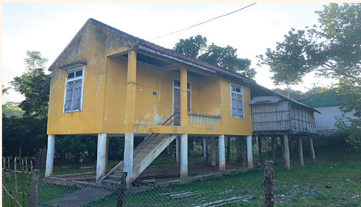
Nhà tái định cư ở bản Văng Môn

của mình. Từ mạng xã hội, họ kết bạn với các thành viên khác mà trước đó họ chưa từng quen biết, tạo lập ra các mạng lưới xã hội mới, mở rộng nguồn lực phát triển của mình. Đặc biệt, với những bạn trẻ năng động, việc vận dụng mạng xã hội để mở rộng quan hệ và kết nối với nhiều người là cơ hội để họ có thể tìm kiếm thêm việc làm, tăng thêm thu nhập. Không ít người đã tận dụng mạng xã hội để buôn bán hàng online và đưa lại những thu nhập nhất định. Nhiều cặp vợ chồng đã bén duyên với nhau từ việc gặp gỡ, trò chuyện qua mạng xã hội. Nhiều thanh niên đã tìm được việc làm phù hợp hơn qua những mối quan hệ xã hội mà họ thiết lập được qua mạng xã hội. Nhiều người ở Đu cũng biết lập các nhóm, các diễn đàn để liên kết, hỗ trợ và giúp đỡ nhau khi đi xa quê làm ăn. Đây là những giá trị tích cực mà công nghệ số đưa lại.