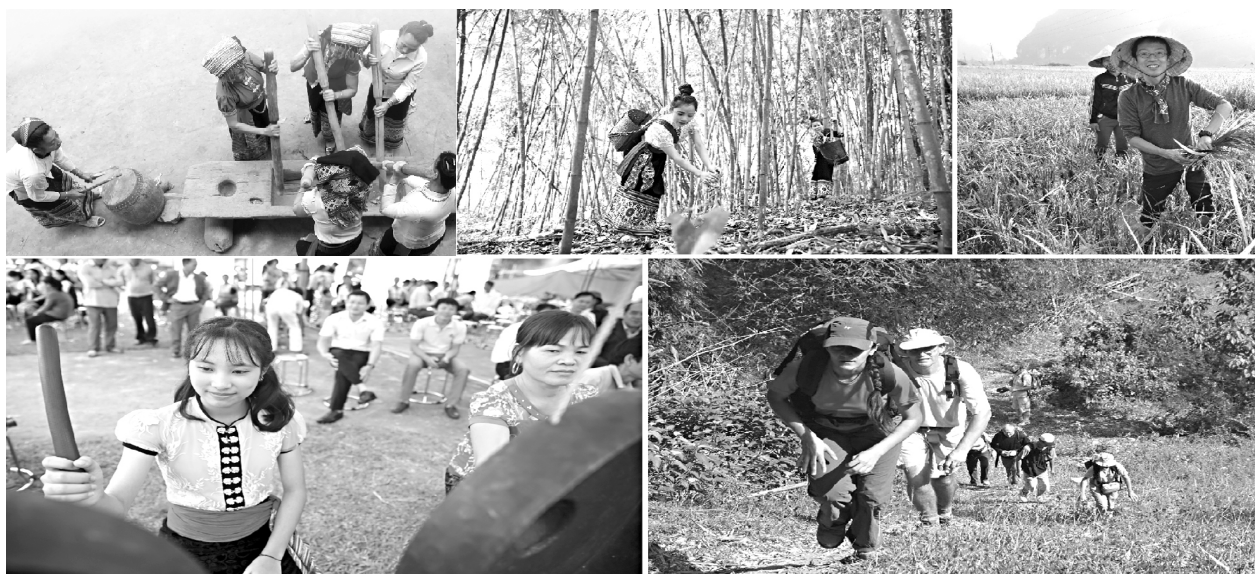
Tạo điều kiện phát triển du lịch sinh thái dựa vào cộng đồng bền vững ở Con Cuông - Nghệ An

Theo Tổ chức Du lịch Thế giới (UNWTO), phát triển du lịch trong bối cảnh kinh tế xanh sẽ nâng cao hiệu quả sử dụng và giảm chi phí về năng lượng, nước, hệ thống xử lý chất thải, góp phần nâng cao giá trị của hệ sinh thái, đa dạng sinh học và di sản văn hóa, đồng thời có tiềm năng tạo những việc làm xanh mới. Du lịch - bao gồm toàn bộ khách du lịch, doanh nghiệp, cộng đồng và chuỗi giá trị du lịch - có thể đóng vai trò quan trọng trong việc chuyển đổi sang hướng tăng trưởng xanh. Vì vậy, việc xác định chuyển đổi từ việc công nhận vai trò thúc đẩy tăng trưởng xanh của du lịch thành các chính sách và hành động cụ thể, ý nghĩa, có khả năng liên kết với toàn bộ chuỗi giá trị của ngành là hết sức cần thiết./.