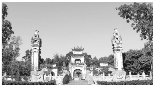
Nét đẹp văn hóa tâm linh ở Cửa Lò