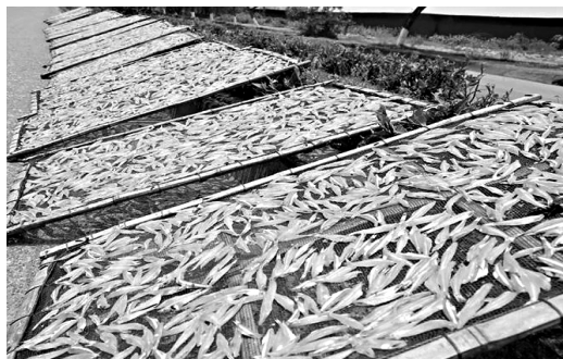
Sản phẩm làng nghề Cửa Lò