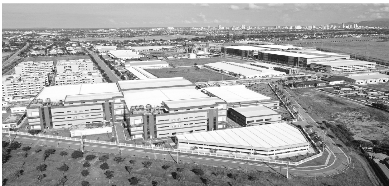
Nghệ An đang đạt nhiều kết quả tích cực trong thu hút vốn FDI

- Để có cơ sở cho việc xây dựng kết cấu hạ tầng phục vụ thu hút đầu tư, UBND tỉnh đã ban hành Đề án phát triển Khu kinh tế Đông Nam thành động lực phát triển kinh tế - xã hội của tỉnh Nghệ An giai đoạn 2021-2025, định hướng đến năm 2030 và kế hoạch thực hiện đề án. Ngoài ra, UBND tỉnh còn ban hành nhiều chính sách ưu đãi cho các nhà đầu tư nước ngoài giá thuê đất, về miễn giảm thuế.