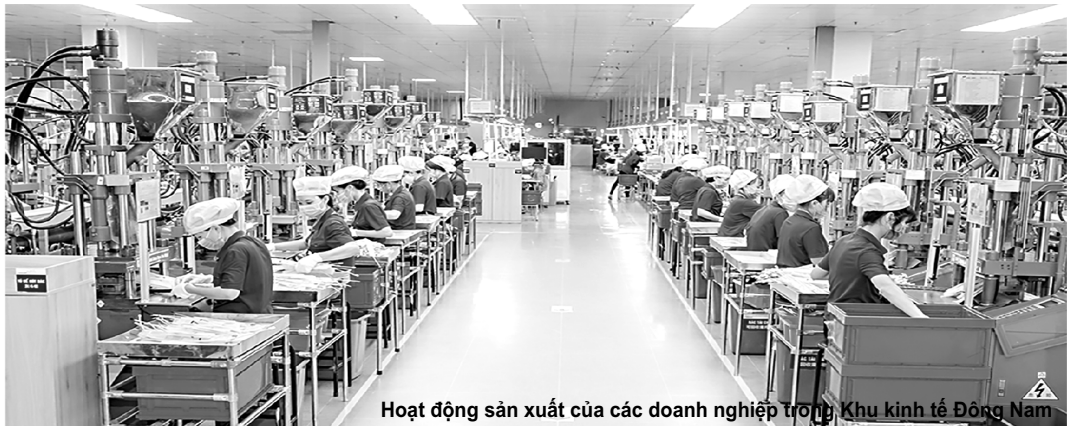
Hoạt động sản xuất của các doanh nghiệp trong Khu kinh tế Đông Nam

Trong hai năm 2022-2023, thu hút FDI ở Nghệ An đạt được nhiều thành tựu đáng tự hào. Năm 2021, Nghệ An xếp thứ 20 về thu hút FDI nhưng cuối năm 2022 đã vươn lên tốp dẫn đầu, xếp thứ 10/63 tỉnh, thành phố. Đến cuối tháng 6/2023, Nghệ An vươn lên vị trí thứ 8 trên cả nước và là tỉnh dẫn đầu về thu hút FDI của khu vực 14 tỉnh vùng Bắc Trung bộ và duyên hải miền Trung. Chúng ta cùng nhìn lại một số thành tựu đã đạt được và thử tìm hiểu điều gì đã góp phần tạo nên một sự khởi sắc ngoạn mục như vậy.