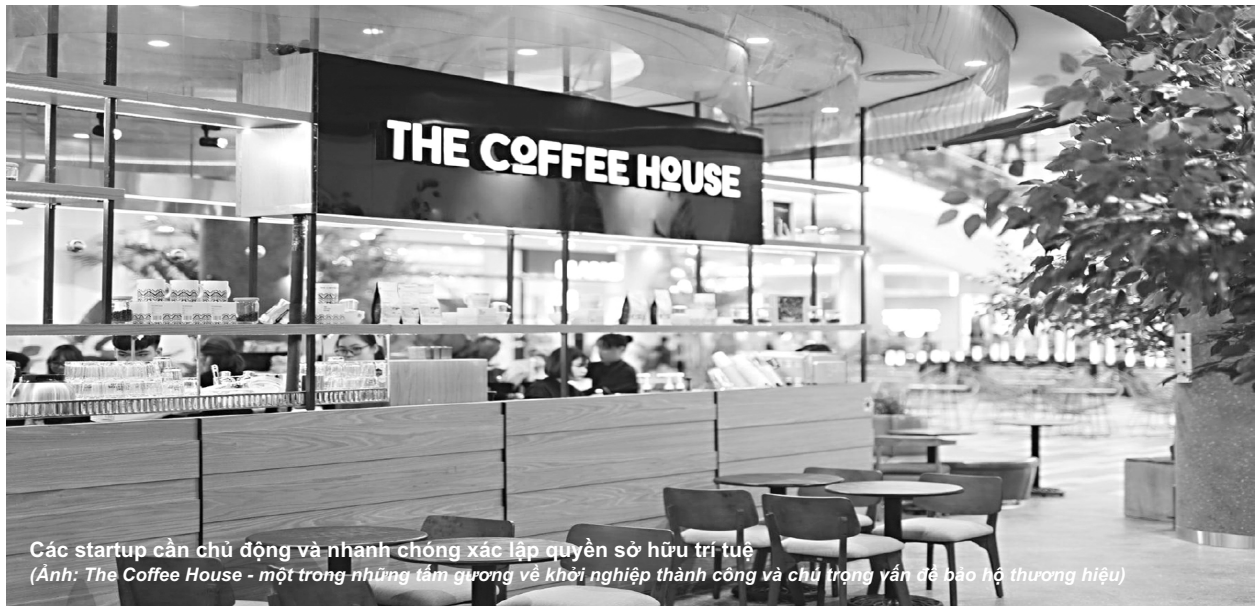
Các startup cần chủ động và nhanh chóng xác lập quyền sở hữu trí tuệ (Ảnh: The Coffee House - một trong những tấm gương về khởi nghiệp thành công và chú trọng vấn đề bảo hộ thương hiệu)

cung cấp không giống nhau và không có khả năng gây nhầm lẫn trong tâm trí người tiêu dùng .