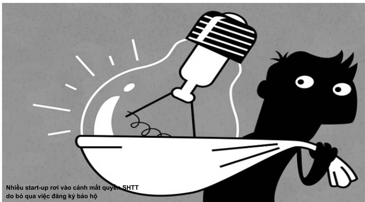
Nhiều start-up rơi vào cảnh mất quyền SHTT do bỏ qua việc đăng ký bảo hộ