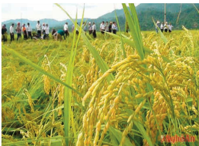
Tuyển chọn bộ giống lúa chịu lạnh Japonica phù hợp điều kiện khí hậu huyện Quế Phong