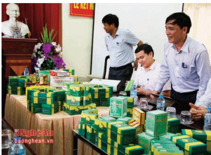
Sản xuất thành công sản phẩm trà hòa tan và viên nang từ trà hoa vàng