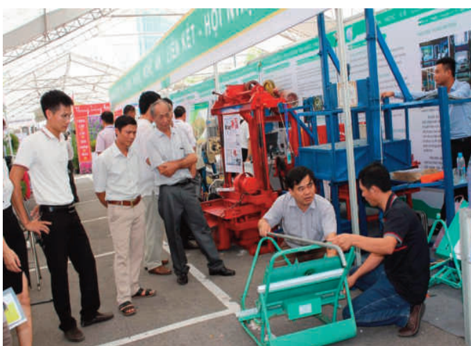
Các sáng chế, cải tiến KHKT của Nghệ An nhận được sự quan tâm tại Chợ CN-TB Hà Nội (10/2016)

3. Trên lĩnh vực nông nghiệp, trong năm qua, tiếp tục ứng dụng nhiều kết quả từ các nghiên cứu khoa học mang lại hiệu quả thiết thực.