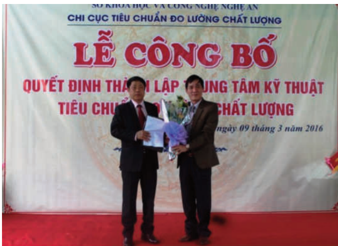
Lễ công bố quyết định thành lập Trung tâm Kỹ thuật Tiêu chuẩn - Đo lường - Chất lượng Nghệ An (9/3/2016)