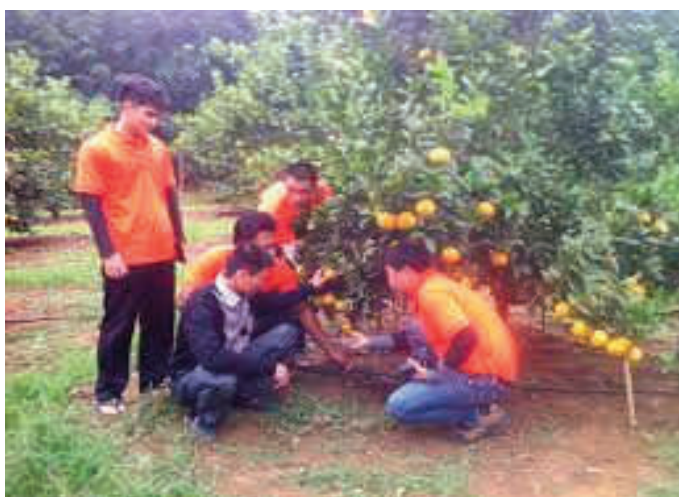
Tưới nhỏ giọt cho cam ở Quỳnh Hợp

Theo đó, một số chế phẩm sinh học đã được nghiên cứu và ứng dụng thành công trong các năm trước tiếp tục được hưởng chính sách hỗ trợ từ 60-100% kinh phí như: chế phẩm Compost maker sản xuất phân bón hữu cơ vi sinh; chế phẩm Biogreen xử lý tồn dư thuốc bảo vệ thực vật trên đất trồng rau; chế phẩm BALASA No1 làm đệm lót sinh học trong chăn nuôi.