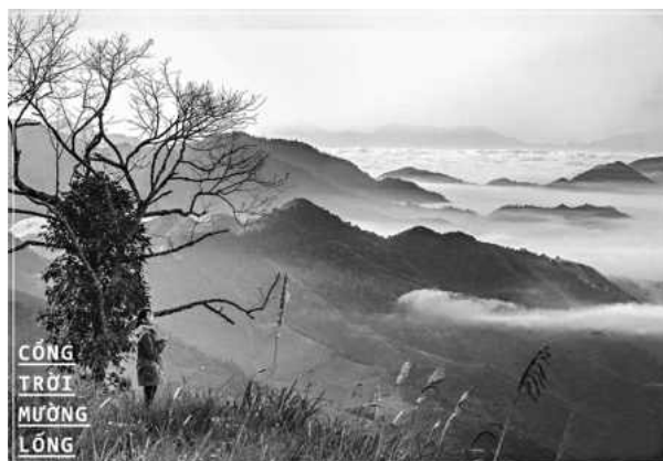
Một số cảnh đẹp miền Tây Nghệ An:

Miền Tây tỉnh Nghệ An bao gồm 11 huyện miền núi, trong đó 5 huyện vùng cao là Kỳ Sơn, Tương Dương, Con Cuông, Quế Phong, Quỳnh Châu và có 6 huyện miền núi là Quỳnh Hợp, Nghĩa Đàn, Thị xã Thái Hòa, Tân Kỳ, Anh Sơn, Thanh Chương, với diện tích gần 1,4 triệu ha, chiếm 84% diện tích toàn tỉnh. Các huyện miền Tây Nghệ An giàu tiềm năng và có nhiều thế mạnh để phát triển ngành du lịch sinh thái, du lịch cộng đồng và hoạt động trải nghiệm. Tuy nhiên trong nhiều năm, qua du lịch miền Tây xứ Nghệ vẫn chưa phát triển tương xứng với các thế mạnh vốn có mình. Bài viết thông qua phân tích và đánh giá thực trạng phát triển du lịch miền Tây tỉnh nghệ An giai đoạn 2015-2019 nhằm đề xuất một số giải pháp mang tính đột phá và sáng tạo thúc đẩy mạnh mẽ sự phát triển của du lịch miền Tây Nghệ An những năm tiếp theo.