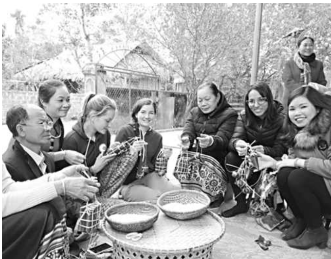
Các huyện miền Tây Nghệ An cần khai thác có hiệu quả các mô hình du lịch cộng đồng

Trong thời gian tới, cần phải huy động tối đa các