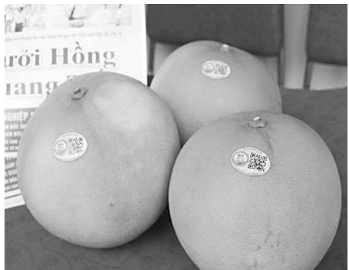
Sản phẩm bưởi hồng Quang Tiến được dán logo nhận diện và tem điện tử truy xuất nguồn gốc

Dự án đã phối hợp với đơn vị tư vấn xây dựng hệ thống tem nhãn, bộ nhận diện cho nhãn hiệu tập thể “Bưởi hồng Quang Tiến”. Tổ chức hội thảo góp ý, xin ý kiến chuyên gia và hoàn thiện bộ lô gô, hệ thống tem, nhãn mác đề xuất đăng ký tại Cục Sở hữu trí tuệ. Xây dựng quy chế sử dụng nhãn hiệu tập thể, lấy ý kiến góp ý của người dân và ý kiến của chuyên gia trong việc sử dụng.