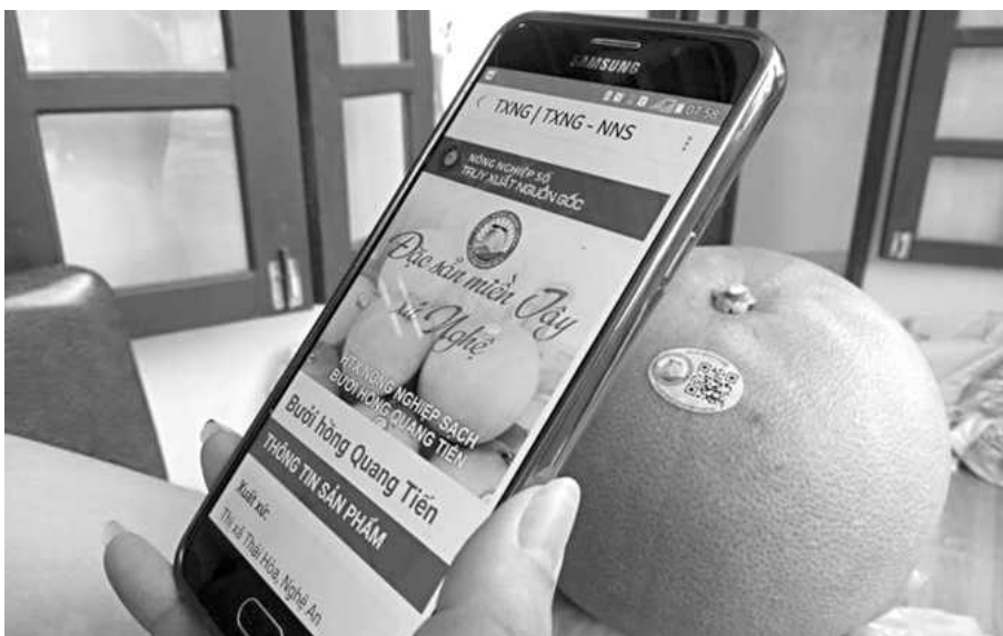
Người tiêu dùng có thể truy xuất nguồn gốc sản phẩm bưởi hồng Quang Tiến bằng điện thoại