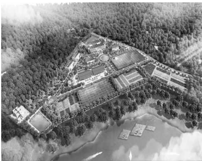
Phối cảnh tổng thể dự án Trung tâm Giống cây lâm nghiệp công nghệ cao Bắc Trung Bộ tại Nghệ An

Trong đề án có 3 phân khu chức năng gồm: Trung tâm sản xuất giống và khu rừng trồng khảo nghiệm, trình diễn, trồng rừng thâm canh, trồng cây dược liệu lâm sản ngoài gỗ; Khu sản xuất chế biến và lâm sản ngoài gỗ ứng dụng CNC; Sàn giao dịch kết hợp triển lãm giới thiệu gỗ nguyên liệu và các sản phẩm chế biến từ gỗ và lâm sản ngoài gỗ. Đề án được hưởng các ưu đãi đầu tư về tiền sử dụng đất, thuế sử dụng đất, hỗ trợ đầu tư hệ thống hạ tầng, thuế nhập khẩu, thu nhập