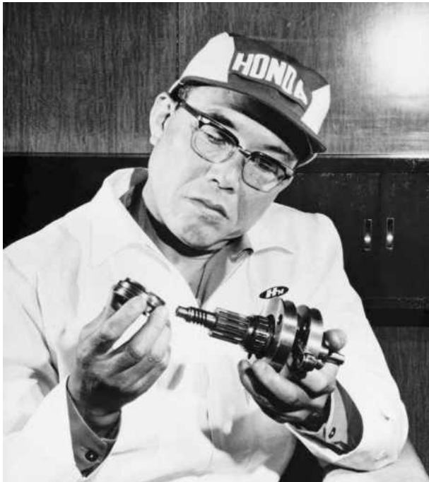
Soichiro Honda đã viết nên những trang huyền thoại về nghị lực, niềm say mê khoa học và tận tâm cống hiến

động viên những người không có đầy đủ bằng cấp nhưng có khả năng thật sự. Soichiro Honda làm việc không mệt mỏi và ông cũng đã truyền được tinh thần đó cho mỗi người làm tại Tập đoàn Honda. Đối với sản phẩm, ưu tiên hàng đầu của Honda là chất lượng. Trong 1000 sản phẩm, chắc chắn có sản phẩm lỗi, nhưng phát hiện ra lỗi, ngay lập tức phải sửa chữa. Uy tín của Honda đã được khách hàng khắp thế giới chứng nhận và tin dùng.