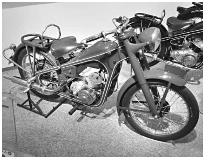
Chiếc xe máy Honda Dream được chế tạo năm 1949