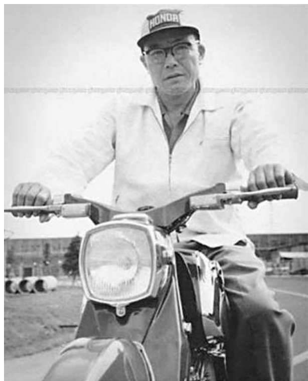
Nguyên mẫu của Honda Super Cub

phẩm. Năm 1946, Soichiro Honda thành lập “Honda Technical Research Institute” (Viện Nghiên cứu kỹ thuật Honda) trong một ngôi nhà gỗ nhỏ. Đó là thời kỳ ngay sau chiến tranh thế giới thứ hai, cơ sở hạ tầng ở nước Nhật bị tàn phá, nước Nhật bị kiểm chế và kiểm soát bởi những thỏa thuận của phe đồng minh. Honda đã nhận ngay ra rằng, một trong những nhu cầu cấp thiết nhất đối với người Nhật là khả năng di chuyển và phương tiện vận tải đơn giản. Sau khi mua lại được 500 động cơ điện do quân đội thải ra, Honda có ngay ý tưởng kinh doanh đầu tiên đơn giản mà độc đáo, tính khả thi về kỹ thuật và hiệu quả kinh tế rất cao, đó là cải tiến xe đạp thành xe đạp máy. Thương hiệu Honda phát tích từ ngôi nhà gỗ nhỏ ấy và ra đời cùng với sản phẩm đầu tiên ấy. Từ xe đạp máy, Honda nghiên cứu và chế tạo ra xe máy động cơ hai kỳ, rồi xe máy động cơ bốn kỳ. Năm 1948, Honda thành lập công ty Honda Motor Co. Ltd cùng với Takeo Fujisawa với tổng số vốn 1 triệu Yên, liên kết cả công ty ban đầu của mình. Chỉ mấy năm sau, động cơ của Honda đã chiếm được 60% thị