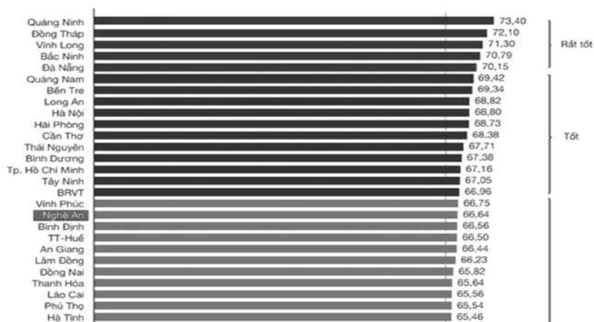
Hình 1.2 Chỉ số Năng lực cạnh tranh cấp tỉnh PCI năm 2019

Nghệ An đứng thứ 18 chỉ số năng lực cạnh tranh cấp tỉnh PCI năm 2019