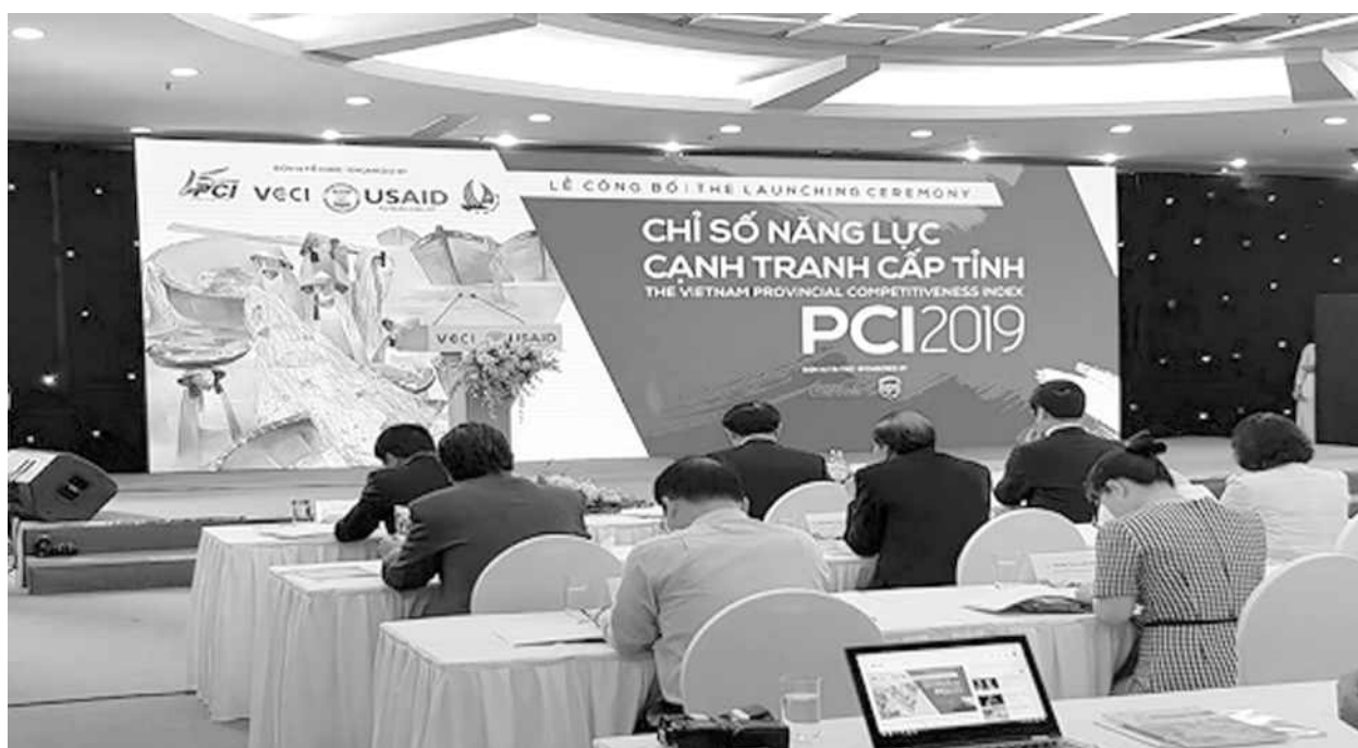
Lễ Công bố chỉ số năng lực cạnh tranh cấp tỉnh PCI 2019 (5/2020)

Ngày 5/5/2020, Phòng Thương mại và Công nghiệp Việt Nam (VCCI) cùng Cơ quan Phát triển Quốc tế Hoa Kỳ (USAID) công bố Báo cáo thường niên Chỉ số Năng lực cạnh tranh cấp tỉnh năm 2019. Báo cáo PCI 2019 dựa trên thông tin phản hồi từ 12.429 doanh nghiệp dân doanh tại 63 tỉnh, thành phố, trong đó có 1.583 doanh nghiệp FDI từ 52 quốc gia, vùng lãnh thổ đang hoạt động tại Việt Nam, chủ yếu là từ Châu Á, trong đó Hàn Quốc (471 doanh nghiệp), Nhật bản (409 doanh nghiệp). Năm nay, tỉnh Nghệ An xếp thứ 18/63 tỉnh, dẫn đầu khu vực Bắc Trung Bộ, là thành tích cao nhất từ trước tới nay của tỉnh.