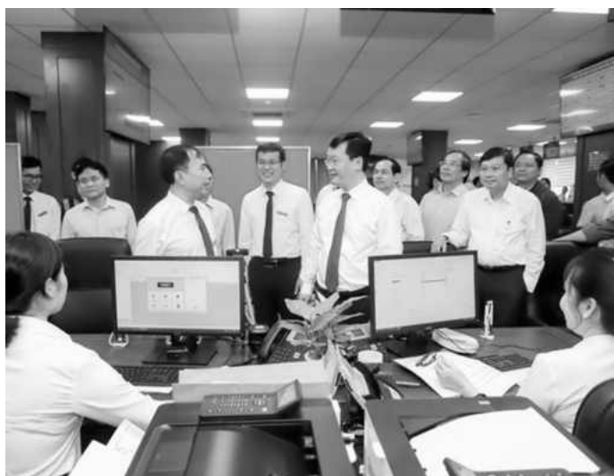
Nâng cao chất lượng, đưa Trung tâm Phục vụ hành chính công của tỉnh vào hoạt động hiệu quả

Năm 2020, đẩy mạnh việc thực hiện, nâng cao chất lượng, hiệu quả công tác cải cách hành chính, thực hiện thành công việc triển khai “ Năm cải cách hành